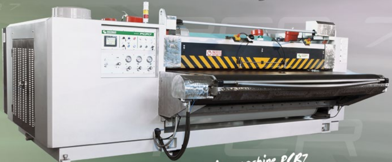
wet blue sammying machine PCR7

the passion remains... ...the technology advances